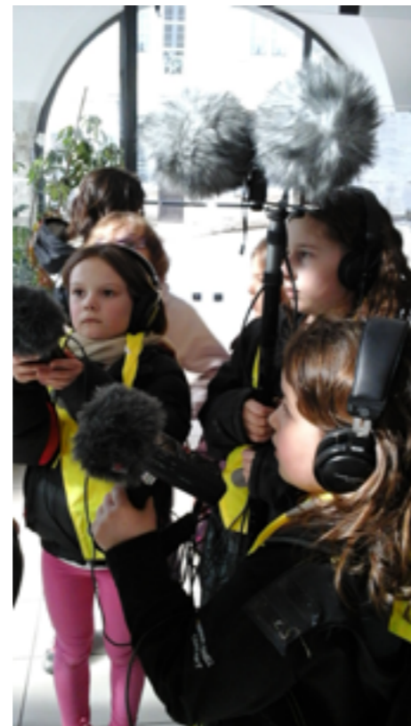
Ateliers à Orgelet, février 2015.

Petits Bruits de Caractère est un programme d'éducation au patrimoine (au sens matériel et immatériel) de 5 communes appartenant au réseau des Petites cités comtoises de caractère. Des groupes d'adolescents et d'enfants d'Ornans, Champlitte, Orgelet, Rougemont et Poligny sont invités sous la conduite d'un binôme composé d'un artiste sonore et d'un architecte et/ou paysagiste à venir réaliser une carte postale sonore représentant leur commune.