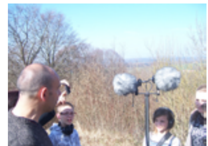
Ateliers à Rougemont mars 2015.